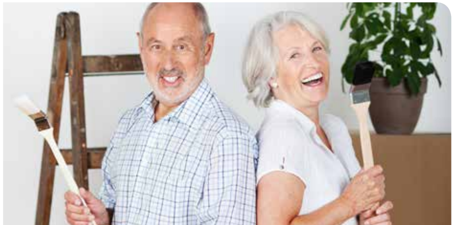
Außen + innen alles NEU: Nutzen Sie unser WoGe-PLUS bei privaten Renovierungen!