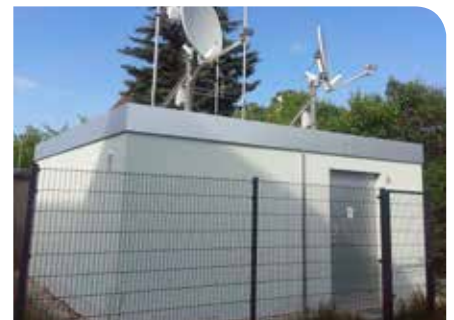
Die Verteilerzentrale für Finsterwalde wurde bereits Am langen Hacken errichtet

Informationen zu den Angeboten der primacom: www.primacom.de oder Hotline 0800 100 35 05 (kostenfrei, Mo.-Sa. von 8 bis 22 Uhr) Persönlicher Beratungstermin gewünscht? Telefon 0800 1020888 (kostenfrei)