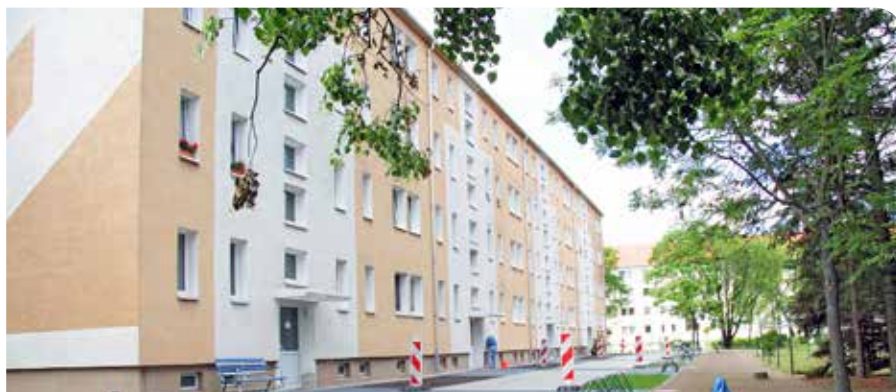
Die Baumaßnahmen im Wohnumfeld der Bayernstraße sind fast fertiggestellt.

» Kennen Sie das wohlige Bauchgefühl, das sich nach einer längeren Reise einstellt, wenn man der Heimat näher kommt? Einen Hauch davon erleben viele Bewohner in der Grenz- und Bayernstraße jetzt jeden Tag. An beiden Objekten wurden bzw. werden Hauszuwegungen komplett erneuert. Hier haben wir eng mit den Stadtwerken Finsterwalde zusammengearbeitet, die die jeweiligen Medienleitungen bis in die Eingänge hinein erneuert haben. Wir haben diese Chance genutzt, um Stolperstellen zu beseitigen und barrierearme Hauszuwege zu schaffen, die gleichzeitig als Feuerwehruzufahrten dienen. Damit wurde auch die Sicherheit für alle Bewohner deutlich erhöht. Stellflächen wurden in diesem Zuge ebenfalls neu und strukturiert angelegt und Fahrräder können nun bequem an neuen praktischen Anlehnbügeln abgestellt und gesichert werden. Aus den Grünflächen sind idyllische, blühende „Vorgärten“ entstanden. Das Ergebnis ist toll geworden: hier beginnt das Zuhause jetzt wirklich schon vor der Haustür.