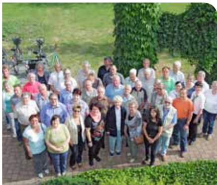
Gelebte Demokratie: unsere Vertreter!