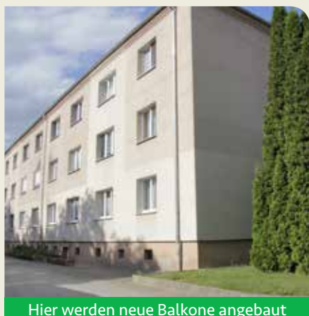
Hier werden neue Balkone angebaut

die Mieter in den Wohnungen. Schichtarbeiter und bedürftige Menschen werden während der Strangsanierung in unseren Gästewohnungen untergebracht.