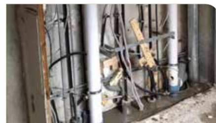
TGA (Technische Gebäudeausrüstung)

In diesem Zusammenhang gilt unseren Mietern ein großer Dank. Es ist nur mit Ihnen gemeinsam möglich, diese Maßnahme umzusetzen. Teilweise bleiben